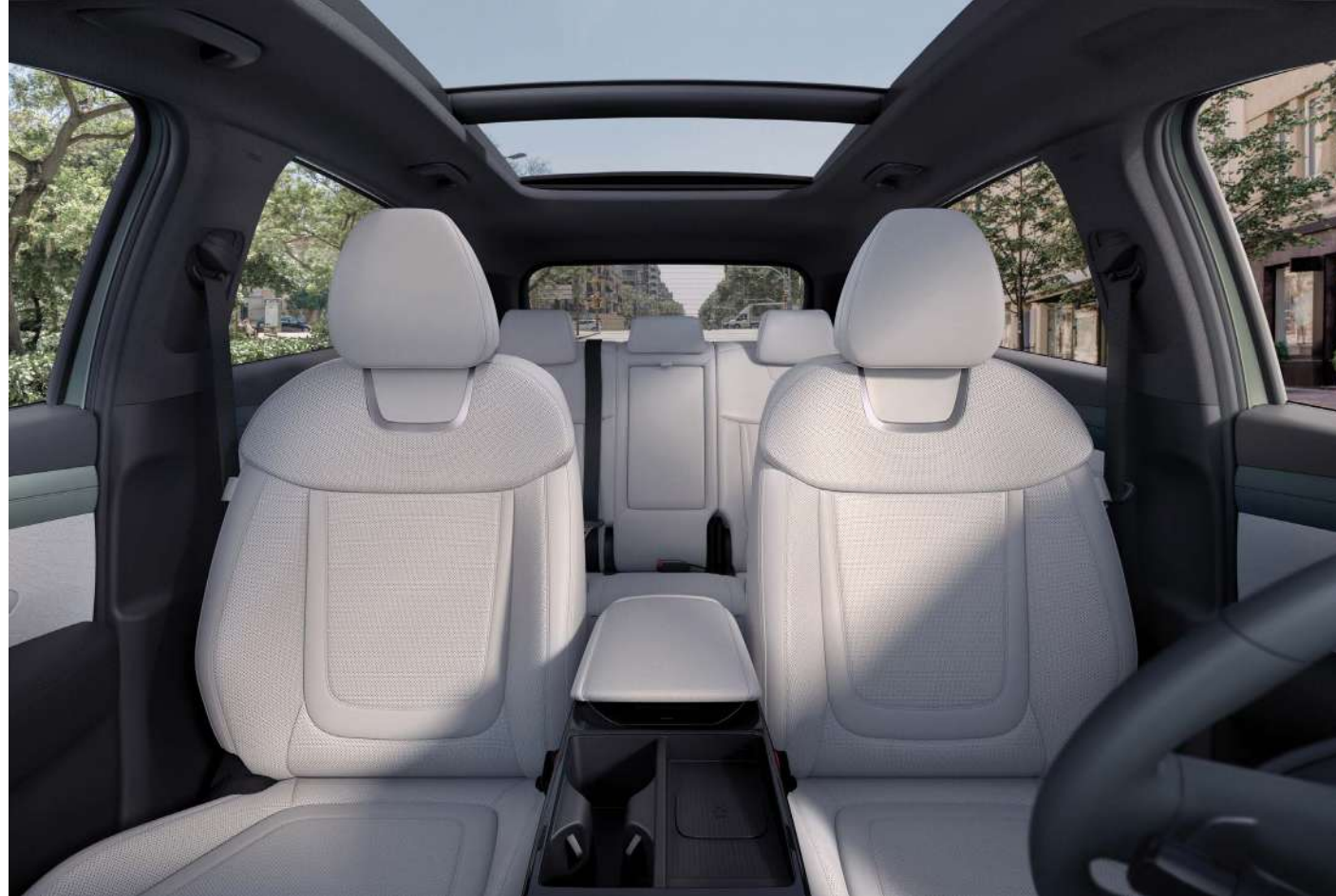
Алдыңғы және артқы орындықтар

Көбірек орын босатыңыз. Өз класындағы жүксалғыш пен салонның сыйымдылығы бойынша ең жақсы көрсеткіштер теңдесі жоқ әмбебаптықты қамтамасыз ете отырып, әртүрлі өмір салты мен іс-шараларға сәйкес келеді.