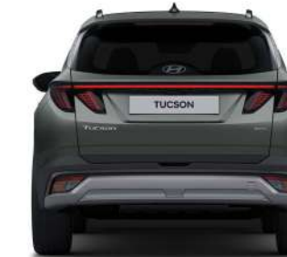
Жолтабан ені (диаметрі 19 дюймдік дөңгелектер үшін)* 1 622

Өлш. бір.: мм * Жолтабанның ені • Диаметрі 17 дюйм дөңгелектер үшін (алдыңғы/артқы): 1 620 / 1 627 • Диаметрі 18 дюйм дөңгелектер үшін (алдыңғы/артқы): 1 615 / 1 622