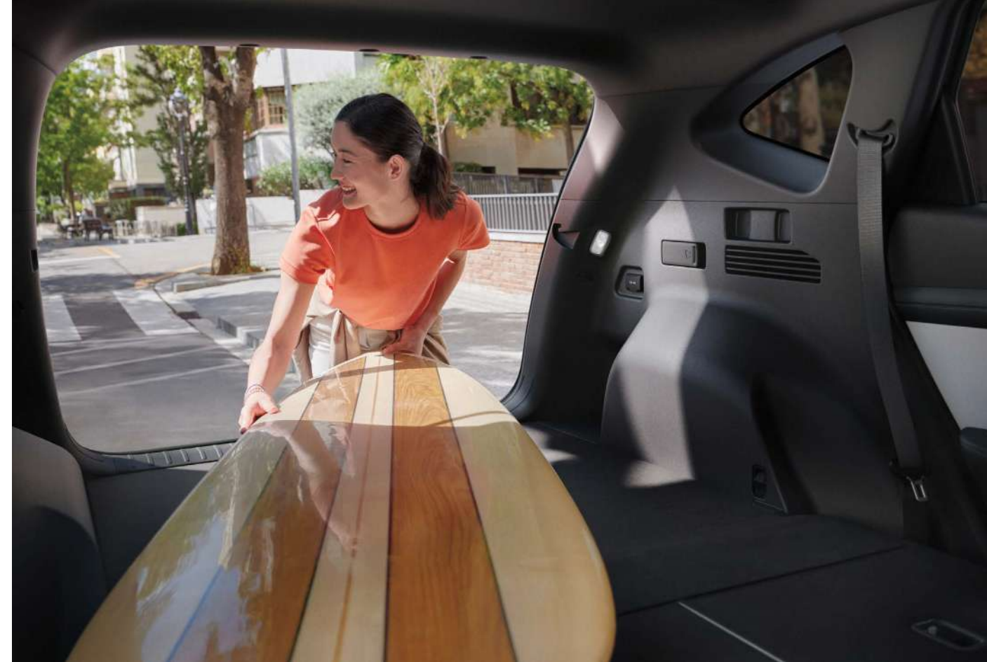
Жиналмалы орындықтар / Қашықтан бүктеу функциясы