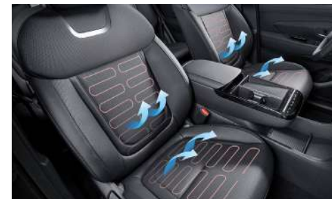
Жылытылатын және желдетілетін алдыңғы орындықтар