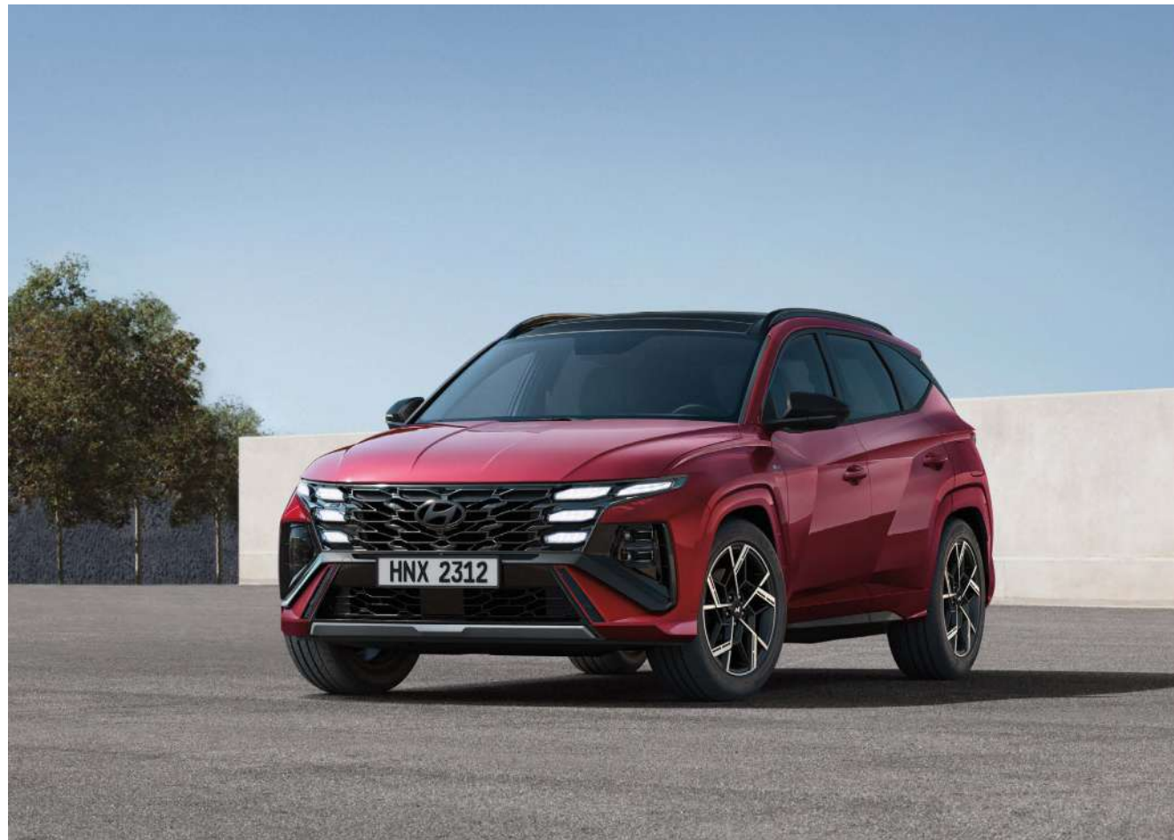
N Line эксклюзивті радиатор торы

Жаңа TUCSON N Line эксклюзивті дизайнға ие болды және қосымша спорттық ерекшелікті қалайтындармен кездесуді күтуде.