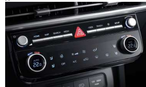
Толық автоматты кондиционерлеу жүйесі