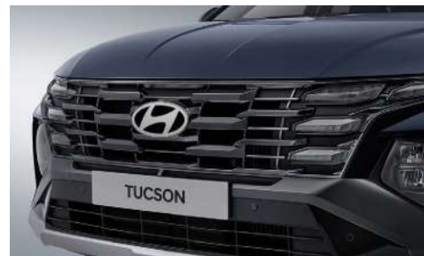
Қара радиатор торы (Clear Type күндізгі жүріс шамдары)