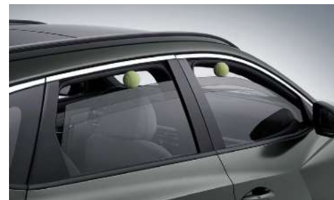
Қысылып қалудан қорғау функциясы бар электрлі әйнек көтергіштер