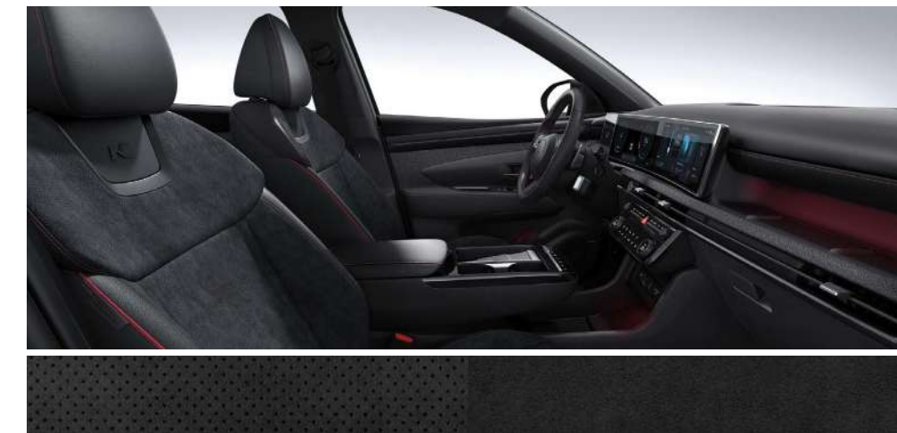
Қара (күдері + былғары) қызыл тігіспен