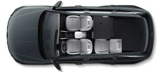
Орындық арқаларын 6:4 қатынасында бүктеу