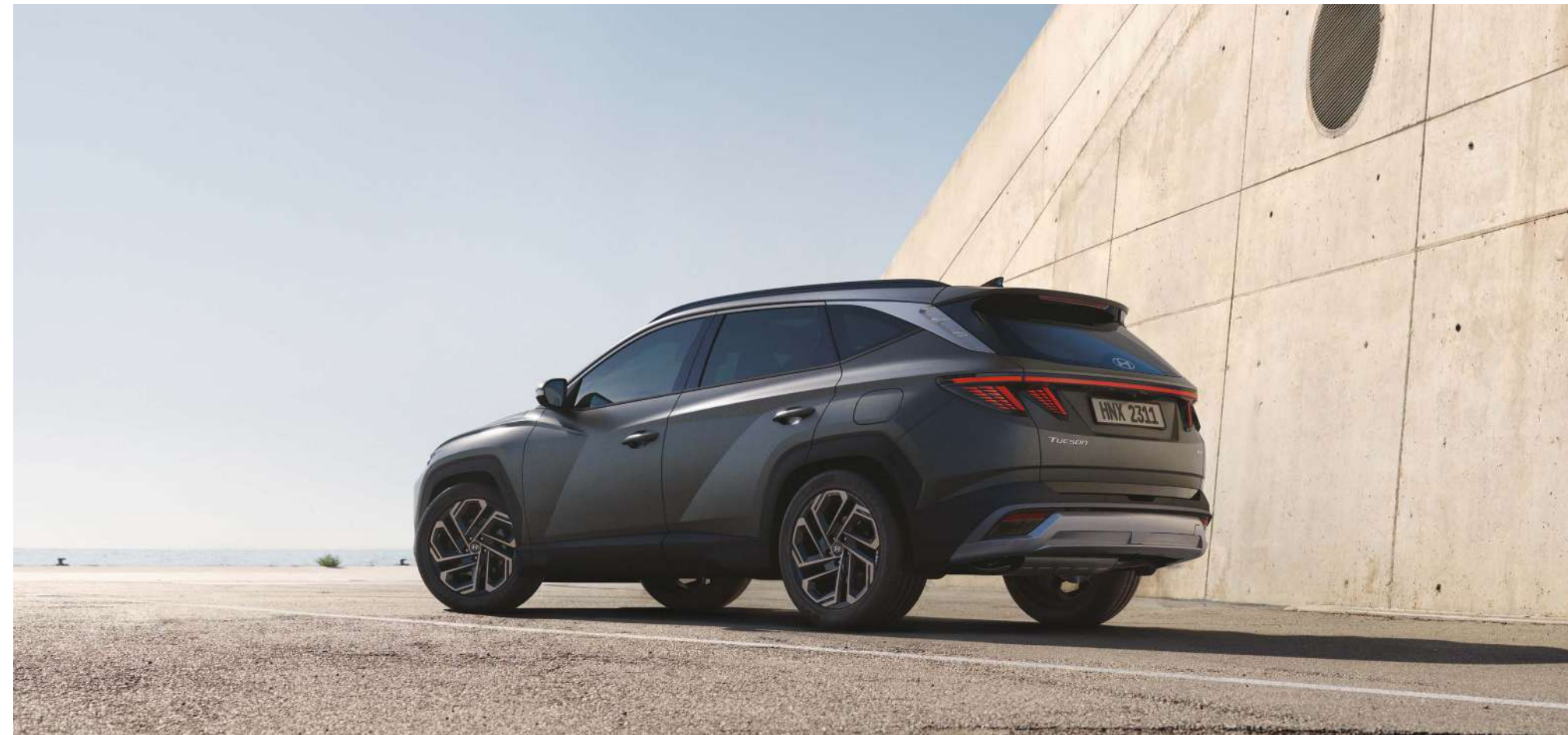
Жарықдиодты артқы аралас шамдар / Артқы бампер / Параметрлік шаңақ панельдерінің дизайны