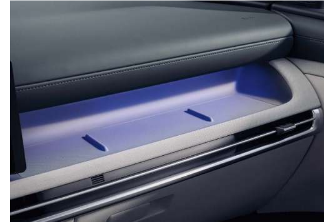
Атмосфералық жарықтандыру / Орталық консольдегі бөлім Қалықтаған консоль