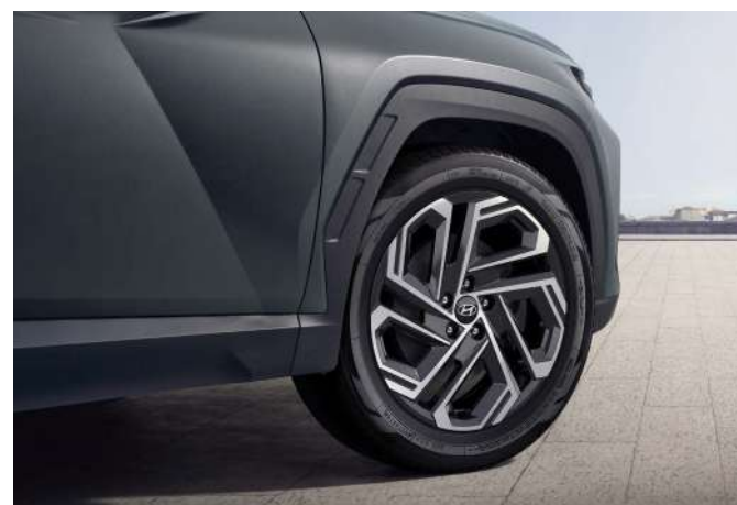
Шатырдағы рейлингтер / Люгі бар панорамалық шатыр 19-дюймдік жеңіл қорытпалы дөңгелек дискілер