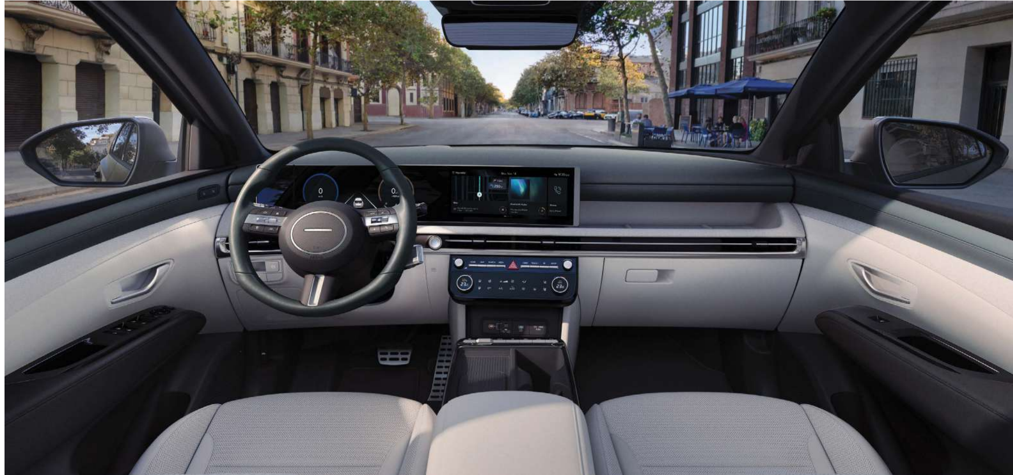
Қоршаған интерьер архитектурасы

Кең көлденең интерьер дизайны жолаушыларды технологиялар мен стильді біріктіретін бірыңғай архитектурамен қоршайды.