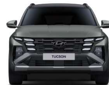
Жолтабан ені (диаметрі 19 дюймдік дөңгелектер үшін)* 1 615 Габаритті ені 1 865