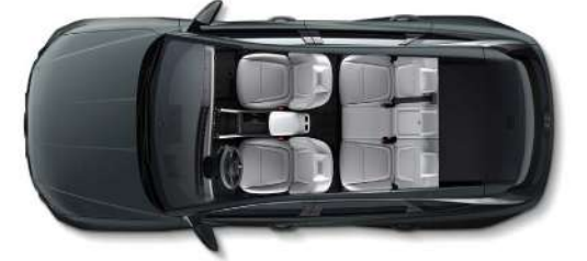
Салонның стандартты жасақталуы