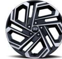
19-дюймдік жеңіл қорытпалы дөңгелек дискілер