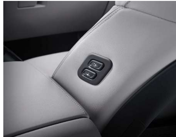
Орындық қалпын есте сақтаудың интеграцияланған жүйесі Жеңілдетілген кіру жүйесі (жолаушы үшін)