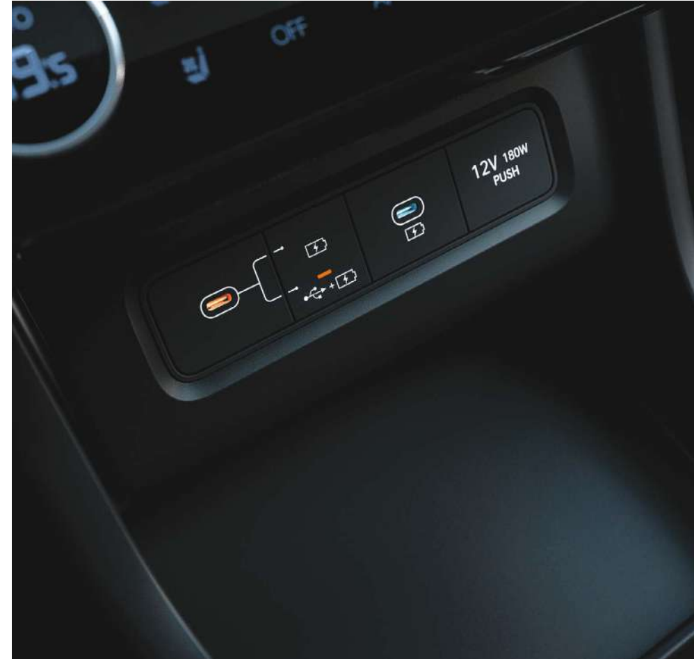
Құрылғыларды зарядтауға және қосуға арналған USB-C порттары