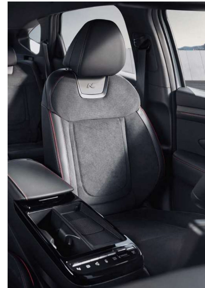
Орындықтардың N Line эксклюзивті күдерімен тысталуы