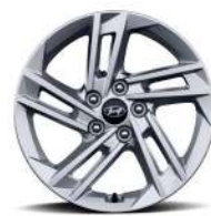
17 дюймдік жеңіл қорытпалы дөңгелек дискілер (NX4)