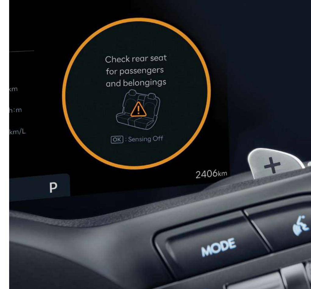
Артқы орындықтарда жолаушылардың бар екендігі туралы ескерту функциясы (ROA)