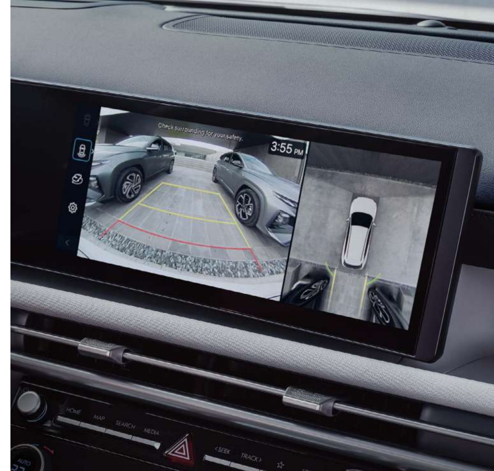
Айнала шолу жүйесі (SVM)