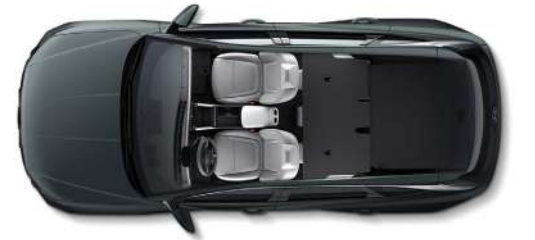
Толық бүктелген артқы орындықтар