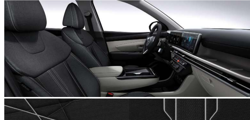
Сұр-қара екі түсті (мата)