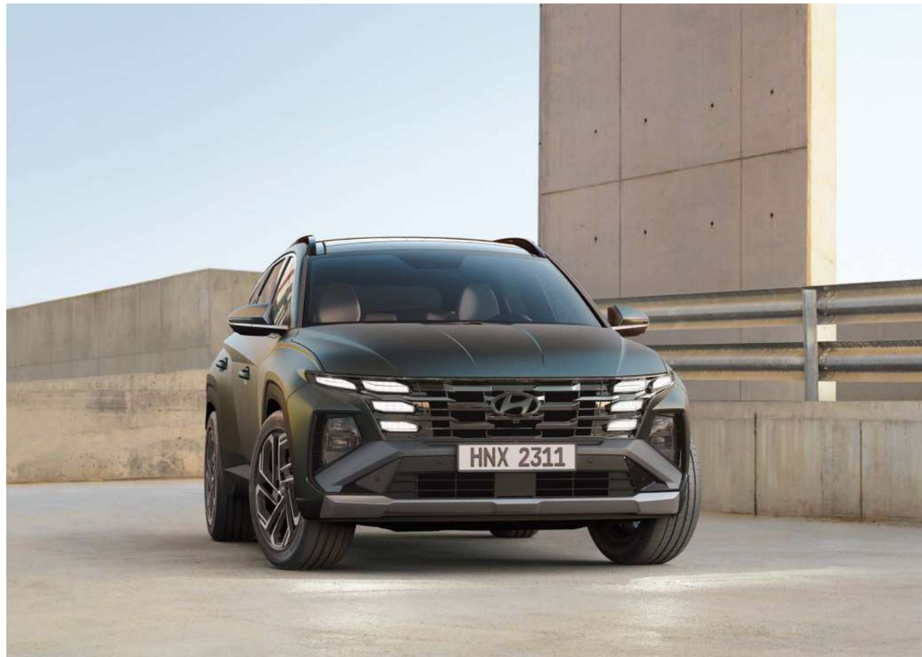
Фирмалық шамдардың параметрлік дизайны / Радиатор торы / Алдыңғы бампер

Асыл тастың қырлылығын еске салатын алдыңғы оптика мен шаңақтың бүйірлік панельдерінің айқын элементтерінің арқасында күнделікті өмірге «жоқ» деңіз. Дизайнның батыл жаңартылуы Сізге жалпы фонда ерекше көрінуге мүмкіндік береді.