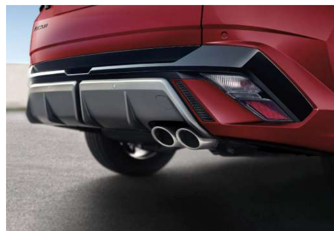
Эксклюзивті 19 дюймдік жеңіл қорытпалы дөңгелек дискілер N Line / Шанақ түсіне боялған жапсырмалар Түтіндіктің эксклюзивті N Line қосарланған келтеқұбырлары