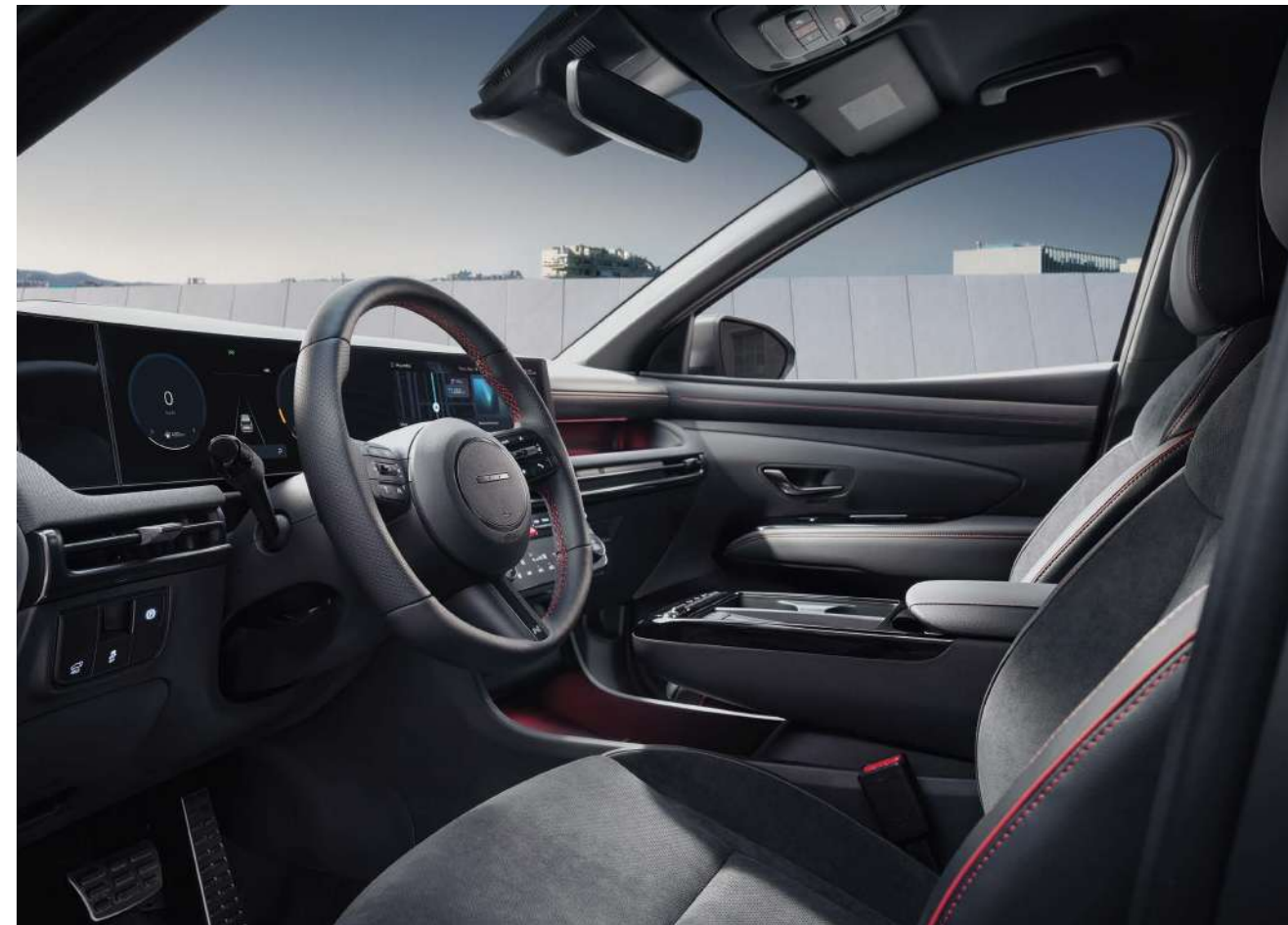
N Line эксклюзивті интерьері (Руль дөңгелегіндегі N Line эмблемасы / Қызыл тігіс)