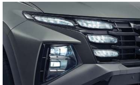
Бас жарықтың толығымен жарықдиодты шамдары (кең жарықтандыру бұрышы және интеллектуалды жарықты басқару жүйесі IFS)