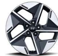
18-дюймдік жеңіл қорытпалы дөңгелек дискілер