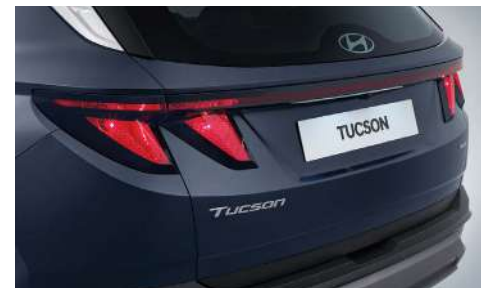
Аралас артқы шамдар (галогенді лампалармен)