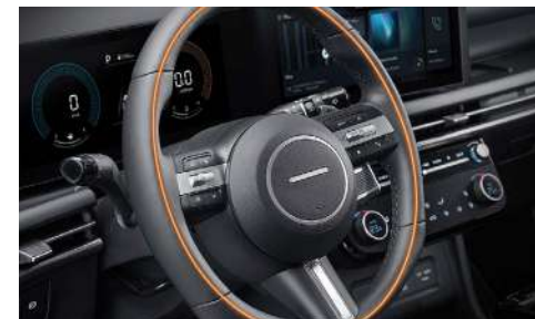
Жылытылатын руль дөңгелегі