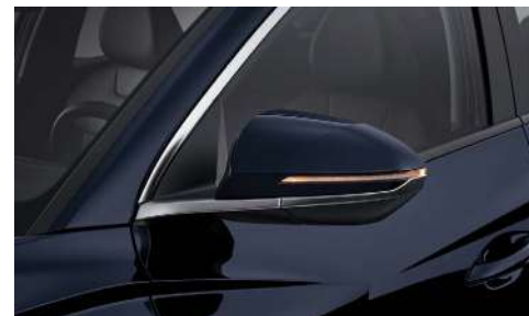
Артқы көрініс айналарының корпусындағы жарықдиодты бұрылыс көрсеткіштері