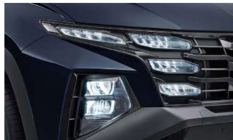
Бас жарықтың толығымен жарықдиодты шамдары (MFR)