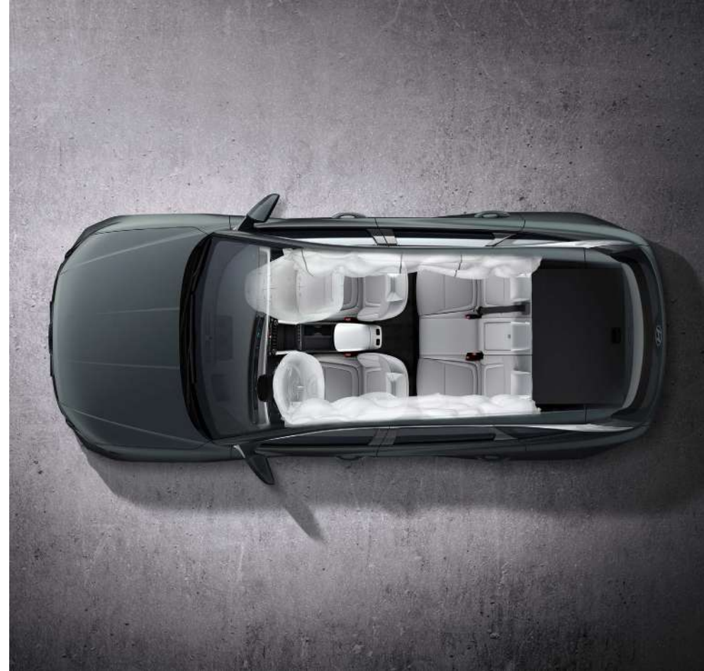
Алты қауіпсіздік көпшігі