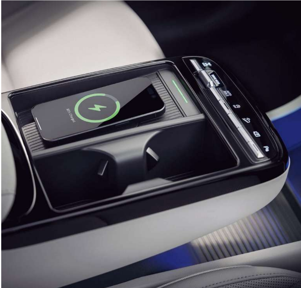
Сымсыз зарядтау құрылғысы

Салонды жасақтаудың жаңа тәсілі және интуитивті технологиялар жиынтығы Сізге автокөлікті жеңіл және ыңғайлы пайдалануға кепілдік береді.