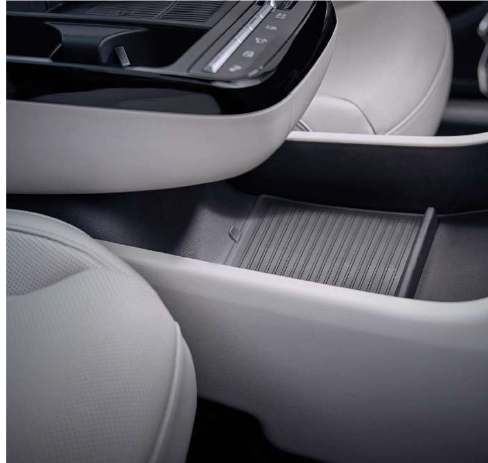
Ыңғайлы сақтау орны