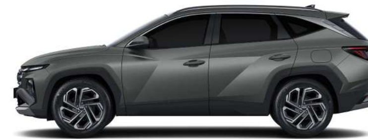
Дөңгелек базасы Габаритті ұзындығы 2 755 4 640

Габаритті биіктігі (шатырында рейтингтері бар)