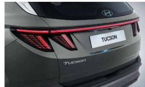
Жарықдиодты аралас артқы шамдар