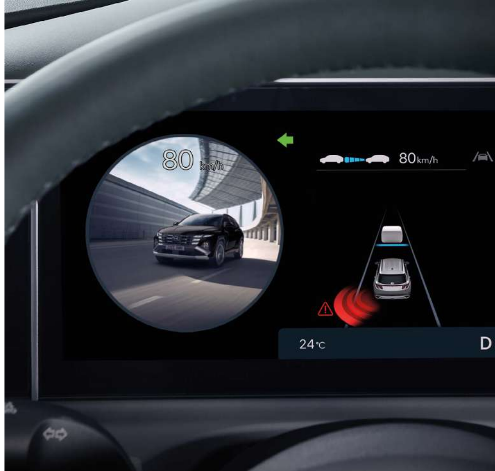
Соқыр аймақтарды бақылау жүйесі (BVM)

Жаңа TUCSON Сізді күтпеген оқиғалардан қорғайтын және салонда ешкімді ұмытып кетпегеніңізді тексеретін сенімді жүйелермен жабдықталған.