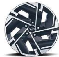
17 дюймдік жеңіл қорытпалы дөңгелек дискілер (NXe)