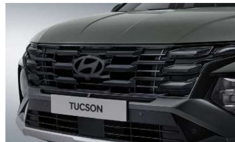
Қара хроммен қапталған радиатор торы (Hidden Lighting күндізгі жүріс шамдары)