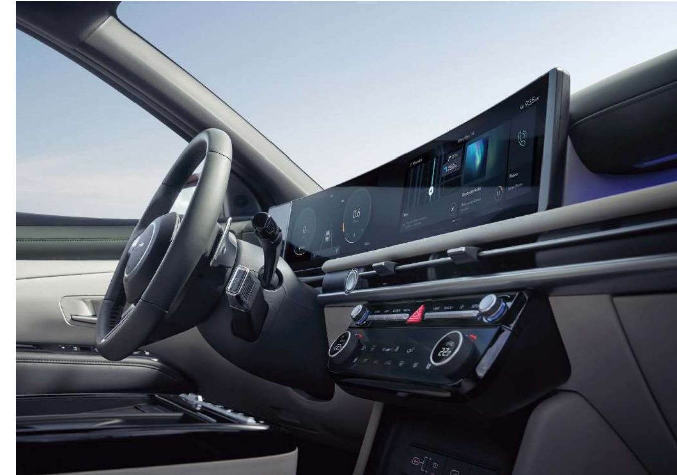
Панорамалық қиғаш дисплей: диагонали 12,3 дюймдік аспаптар панелі және диагонали 12,3 дюймдік орталық дисплей