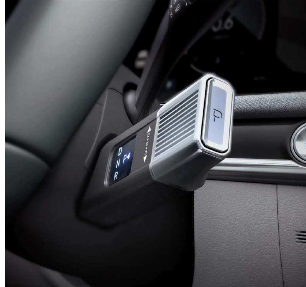
Руль бағанындағы беріліс селекторының интірегі (SBW)