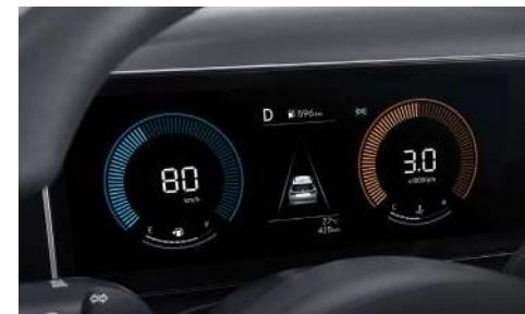
Аспаптар панелінің 4,2 дюймдік СК-дисплейі