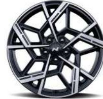
19 дюймдік жеңіл қорытпалы дөңгелек дискілер (N Line нұсқасы)